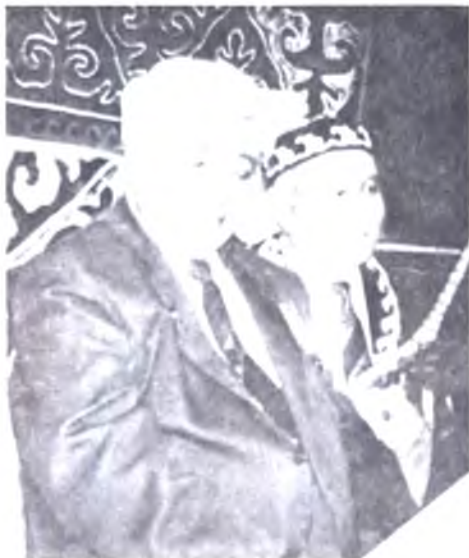
Халық қаһарманы Қасым Қайсенов пен Иран сахнада.