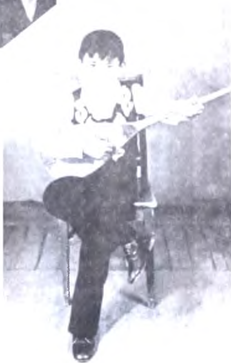
16 жасында қайтыс болған Иранның • үлкен ұлы Ерлан 11 жаста.